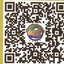
Download คู่มือการสรรหา ปราชญ์เกษตรของแผ่นดิน

สอบถามรายละเอียดเพิ่มเติมได้ที่ กลุ่มพัฒนาเกษตรกรและชุมชนเกษตรกร กองนโยบายเทคโนโลยีเพื่อการเกษตรและเกษตรกรรมยั่งยืน สำนักงานปลัดกระทรวงเกษตรและสหกรณ์ โทรศัพท์ ๐-๒๖๒๙-๘๙๗๓, ๐-๒๖๒๙-๘๙๗๔ เลขที่ ๓ ถนนราชดำเนินนอก บ้านพานถม พระนคร กรุงเทพฯ ๑๐๒๐๐ หรือ สอบถามได้ที่สำนักงานเกษตรและสหกรณ์จังหวัดทั่วประเทศ