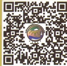
Download ไปสเตอร์และแผ่นพับ